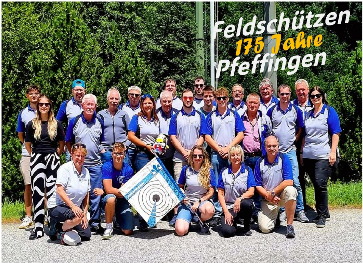
Die Feldschützen Pfeffingen heissen Euch am 4. Birseckschiessen willkommen und wünschen allen 'Guet Schuss'