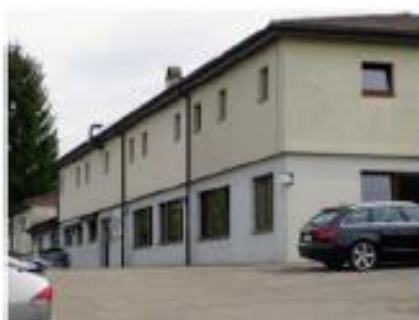
Ruhig und abgelegen