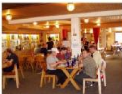
Schützenstube für 58 Personen