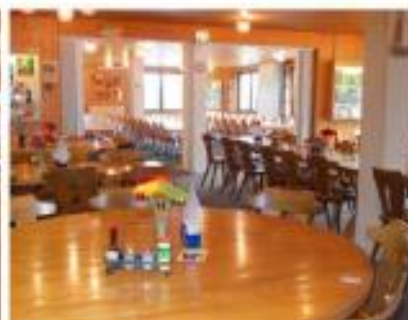
und Saal für 72 Personen